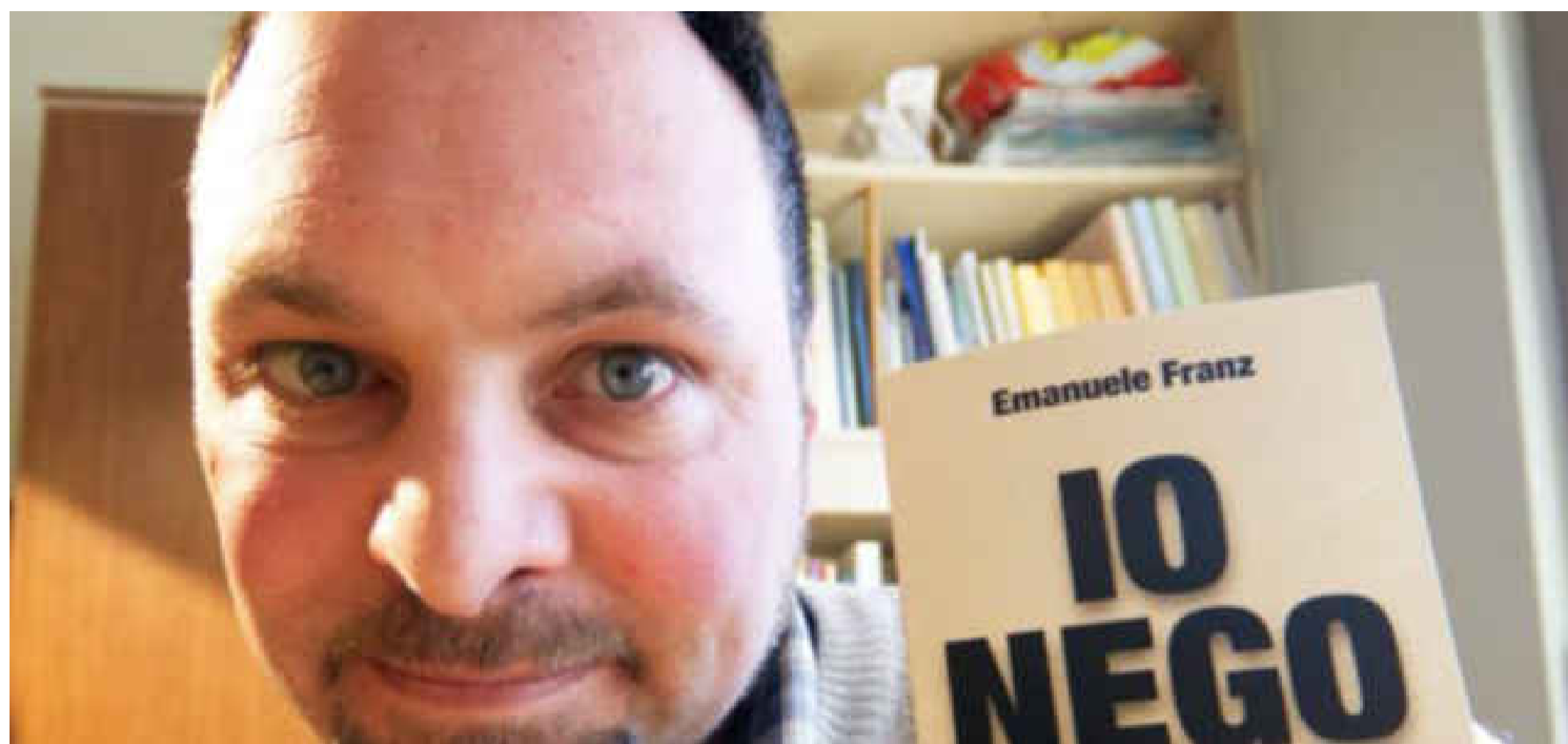
Emanuele Franz

Il filosofo e scrittore Emanuele Franz, aggredito a causa delle sue idee contro le misure anti-Covid adottate da Speranza: “Sono sotto choc”